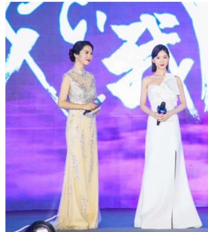
『关晓彤』-护肤品代言采访