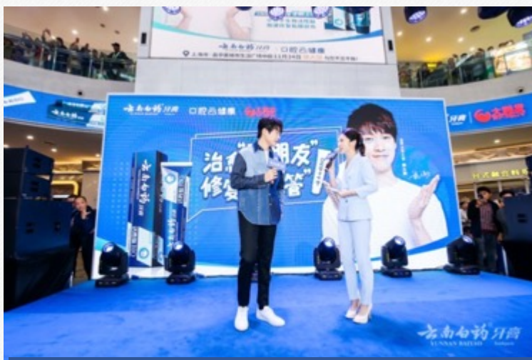
『魏大勋』-云南白药采访