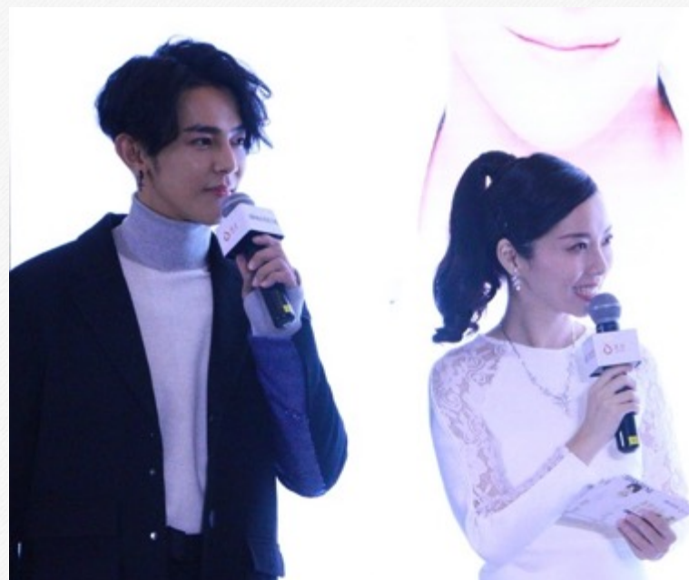
『郁可唯』-江苏卫视采访