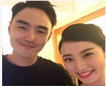
『阮经天』-受邀虎牙平台采访