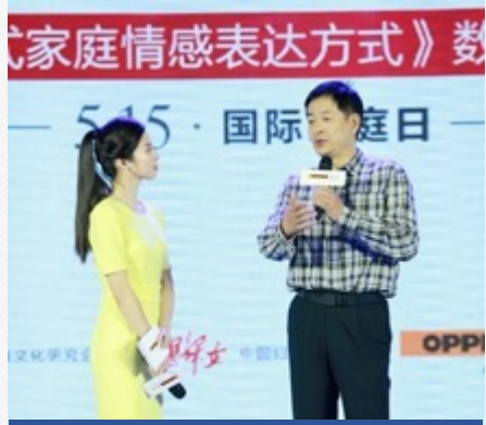
『濮存昕』-国际家庭日公益活动采访