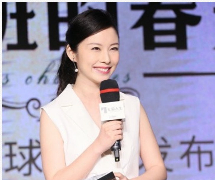
音乐剧《放牛班的春天》中文版发布