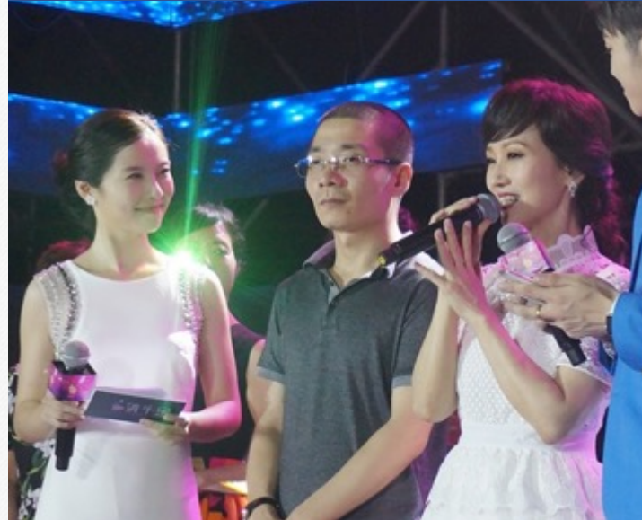
『赵雅芝、任贤齐』-选美大赛采访