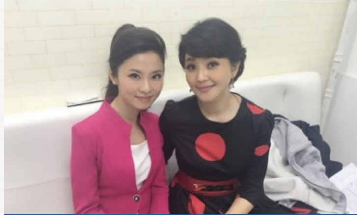
『瞿颖、火风、方琼』-云南卫视节目采访