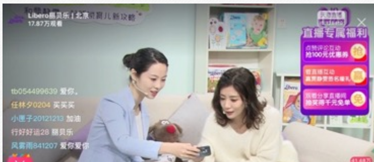
『贾静雯』-母婴直播采访