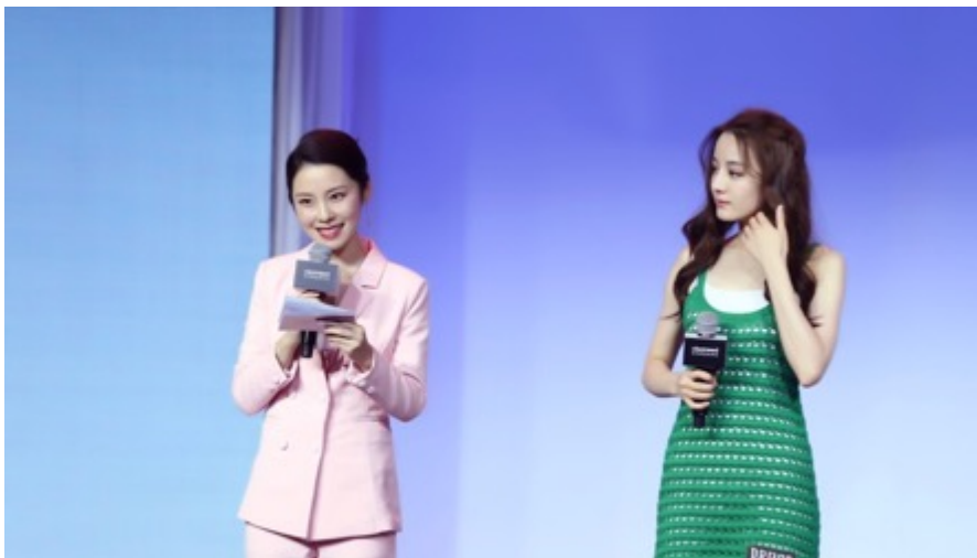
『迪丽热巴』-护肤品代言采访