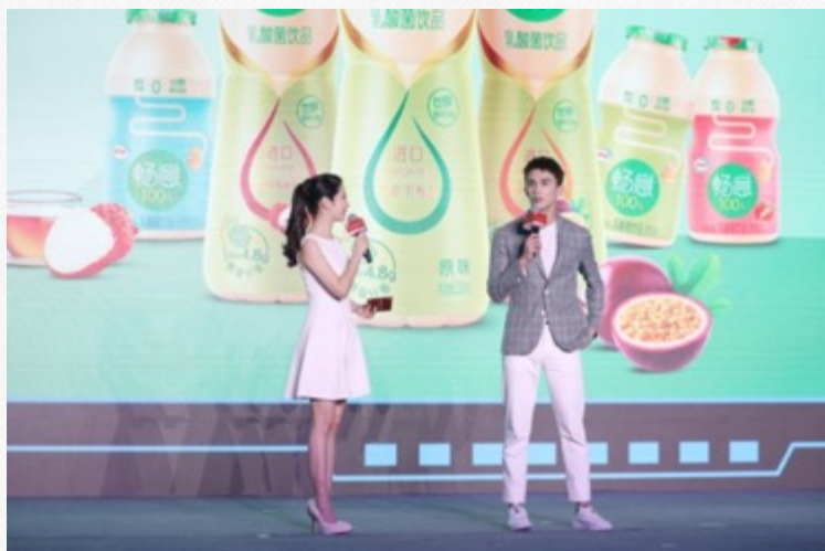
『王一博』-护肤品代言采访