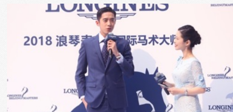
『林心如、彭于晏、梁靖康』-浪琴国际马术大师赛采访