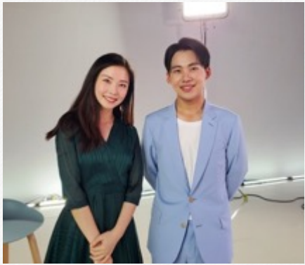
『郭麒麟』 -高夫品牌采访