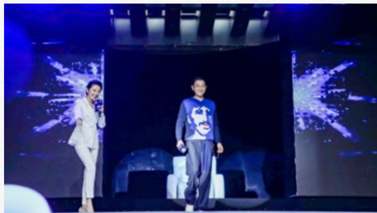
『刘德华』-芝华仕采访