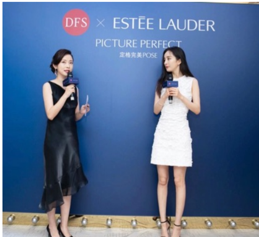
『杨幂』-雅诗兰黛媒体日采访