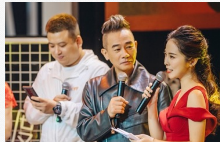
『陈小春』-快手年货节采访