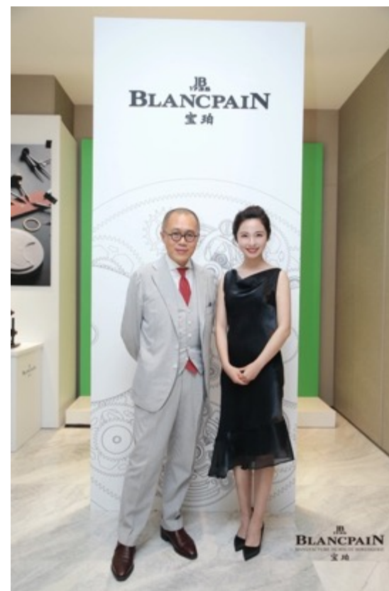
宝珀表 文化私享会 嘉宾：梁文道