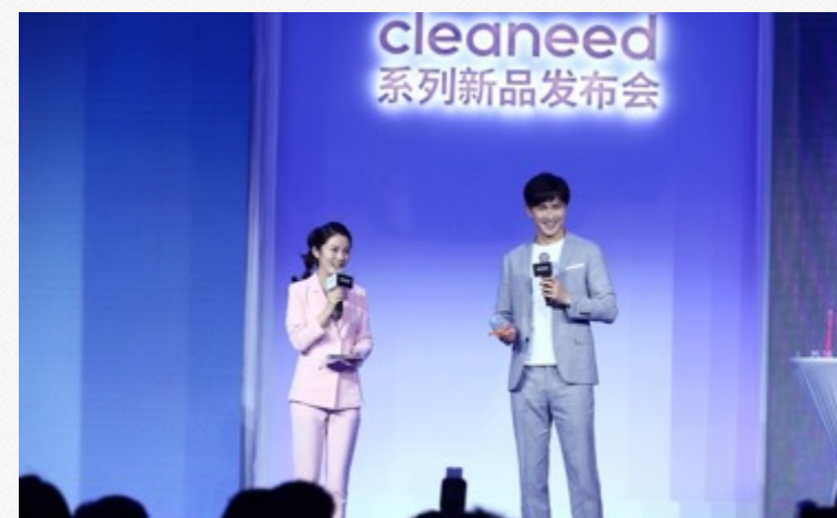
『高伟光』-护肤品代言采访