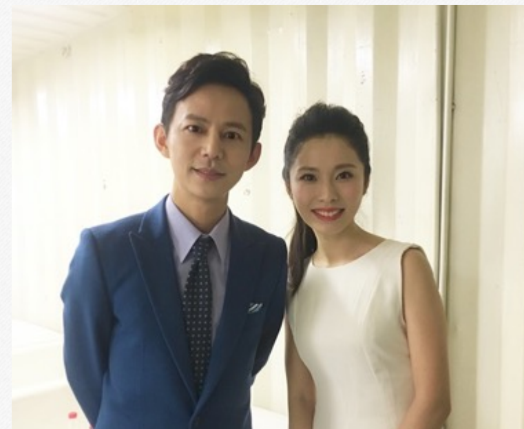
『何炅』-佳洁士新春团圆宴采访