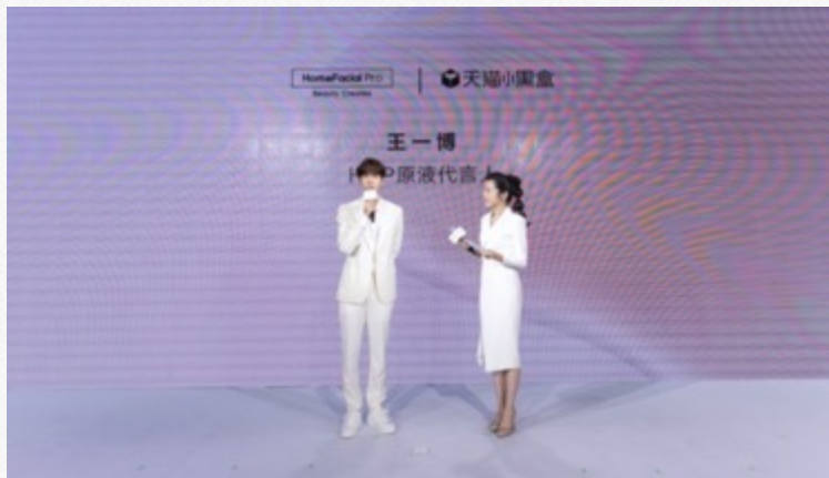
『王一博』-护肤品代言采访